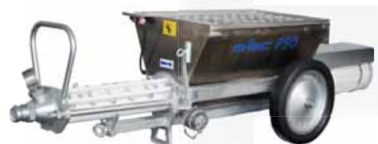
m-tec P50, 5,5 kW mit 90l Trog sowie optionalem Schlauchdruckmanometer und Verschluss-Stopfen