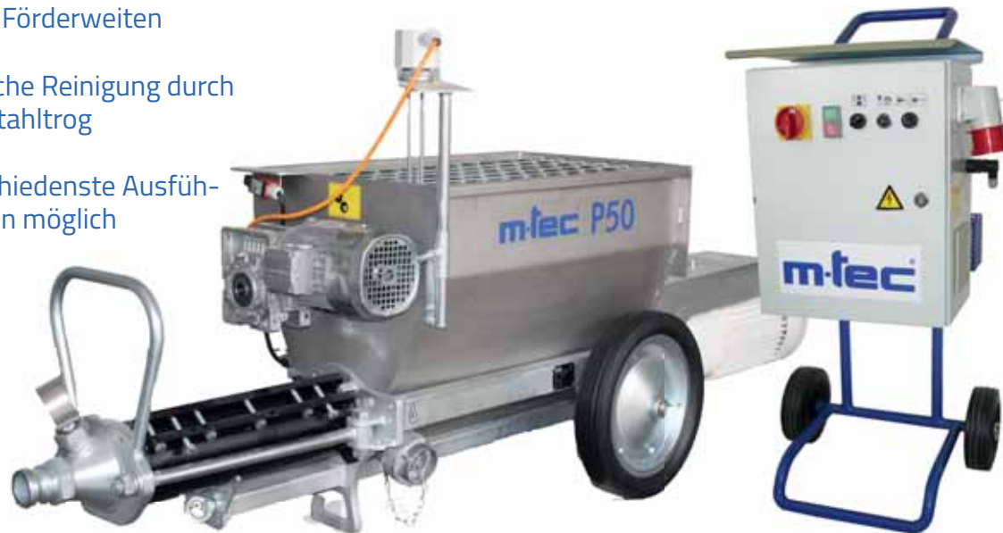
Bild zeigt P50 in 9,0 kW-Ausführung mit optionalem 120l Trog, separatem Rührwerk, Schlauchdruckmanometer und Verschlussstopfen

Die neue m-tec P50 ist eine kraftvolle Pumpe zum Verarbeiten von pumpfähigen Produkten bis 8 mm Körnung. Dabei wird die m-tec P50 hauptsächlich bei der Verarbeitung von Mörtel, Beton, Putz oder Edelputz sowie Fließestrich eingesetzt. Für die unterschiedlichen Einsatzgebiete stehen verschiedene Optionen mit Fördermengen bis zu 140 l/min zur Auswahl.